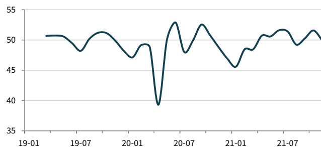
Tengri Partners PMI Обрабатывающих отраслей Казахстана ск. >50 = улучшение по сравнению с прошлым месяцем