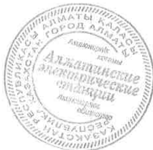
Нукушева Ж.О. Главный бухгалтер