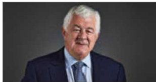
Г-н Ричард Берроуз Неисполнительный директор

Внешние назначения Вице-министр юстиции Республики Казахстан.