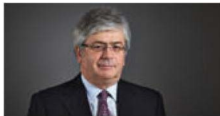
Г-н Феликс Вулис Главный исполнительный директор

Внешние назначения Президент Bank von Roll, частного банка в Швейцарии.