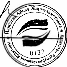
Айсүлү Нарбаева Аудитор

Квалификационное свидетельство аудитора № 0000137 от 21 октября 1994 года