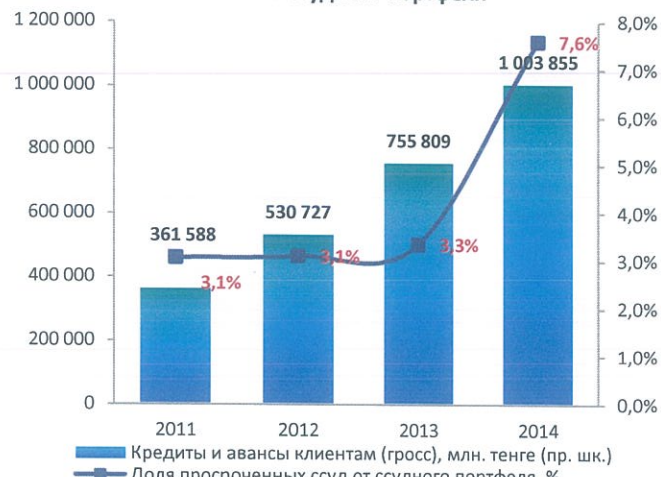
Качество ссудного портфеля